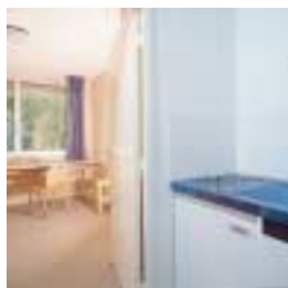
Le coin cuisine / The cooking corner

Le coin cuisine : réfrigérateur, plaques électriques, meuble de rangement, évier.