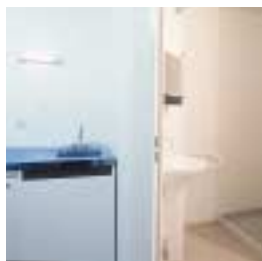
Le cabinet de toilettes / Toilet corner

Le séjour : bureau, bibliothèque avec plan de travail, lit en 200 avec matelas, alèse, chaise, étagère ou chevet-tabouret, volets roulants et voilage au RdC, double-rideaux à l'étage.